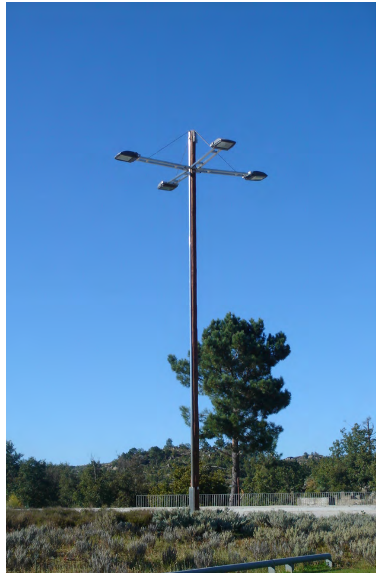
PARQUE TERMAL DO CRÓ Sabugal, 2010