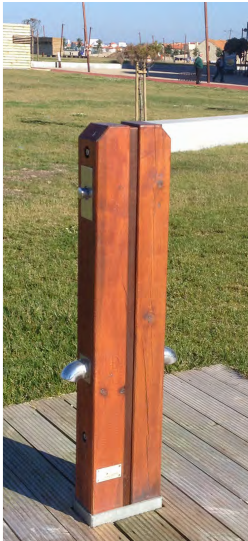
PRAIA DA FRAGOSA Póvoa de Varzim, 2015