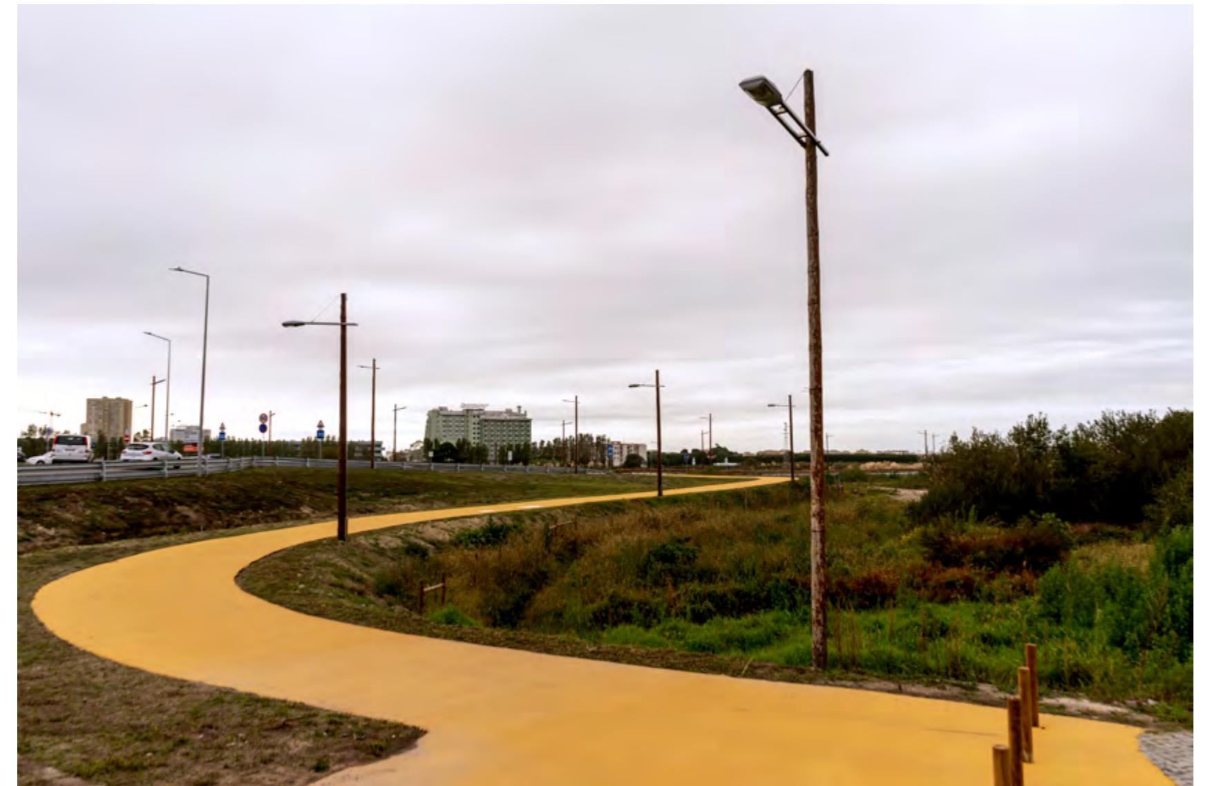
PARQUE DA CIDADE Póvoa de Varzim, 2002