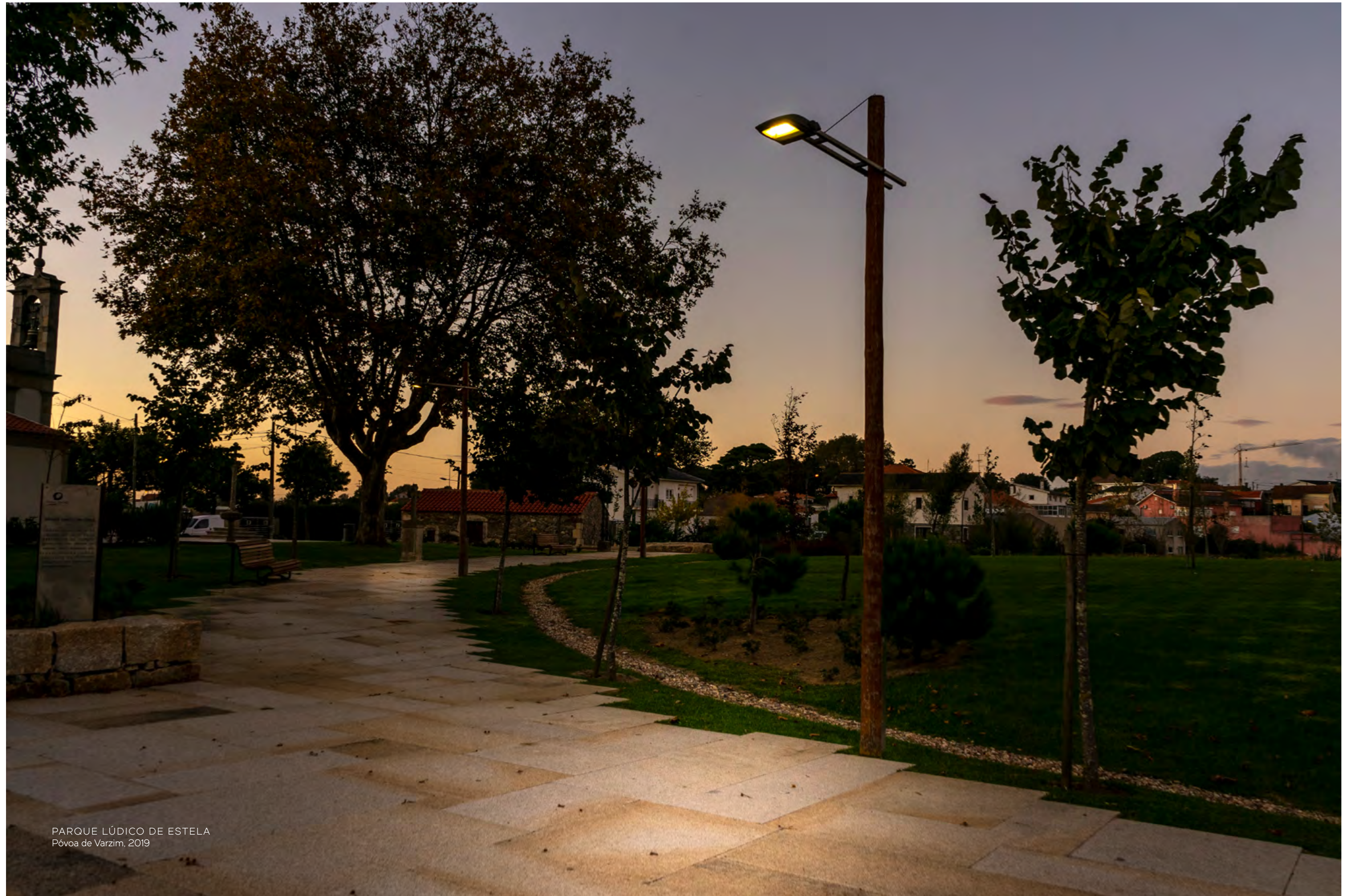
PARQUE LÚDICO DE ESTELA Póvoa de Varzim, 2019