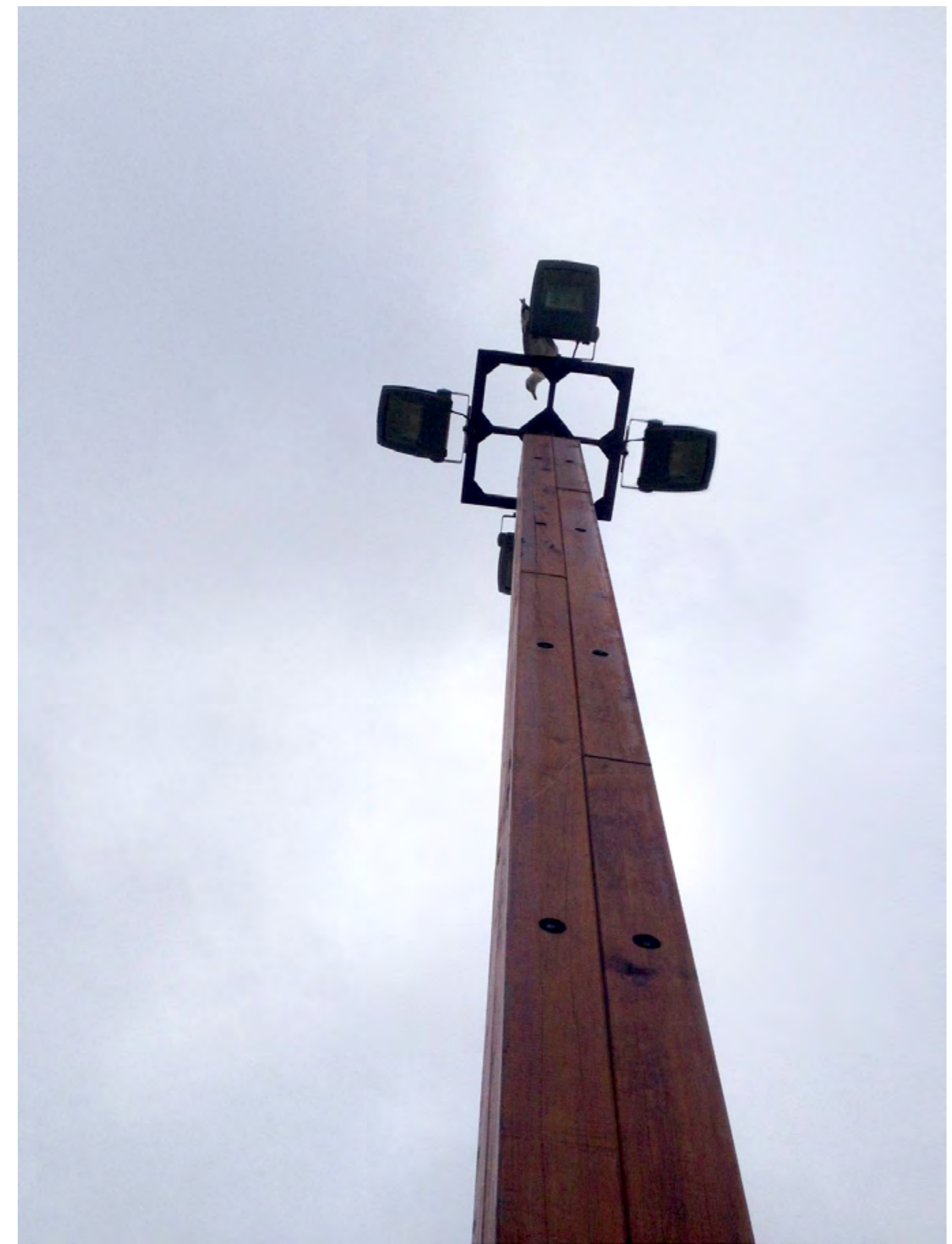
PRAIA DA FRAGOSA Póvoa de Varzim, 2015