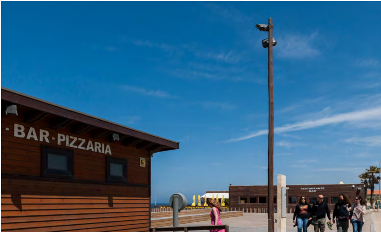
PRAIA DA LABRUGE Vila do Conde, 2008