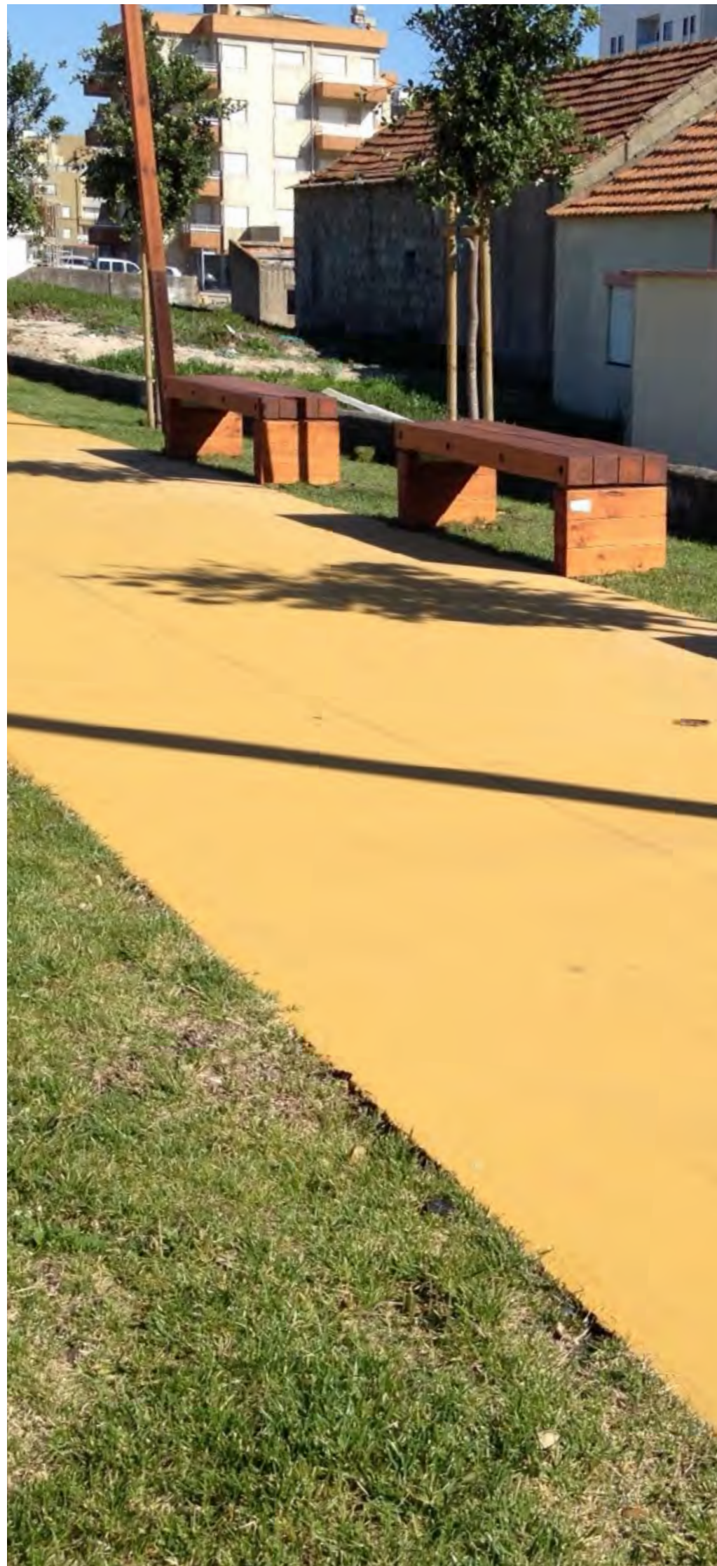
PRAIA DA FRAGOSA Póvoa de Varzim, 2015