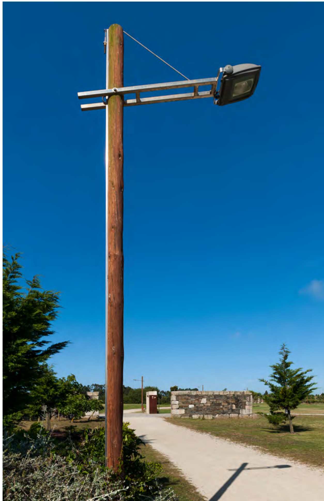
PARQUE DA CIDADE Póvoa de Varzim, 2009